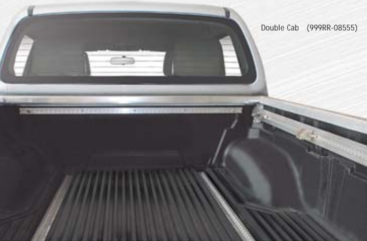
Double Cab (999RR-08555)

Le bac de benne sans protection des bords est employé en cas de montage d'un hardtop, couvre-benne ou d'un arceau de sécurité vissé sur le bord de la benne.